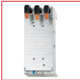
MC195700 – FRONTANSICHT