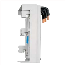
MC195700 – SEITENANSICHT