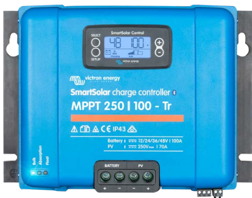
SmartSolar-Laderegler MPPT 250/100-Tr mit einsteckbarem Display

Gleicht Konstant- und Ladeerhaltungsspannungen nach Temperatur aus.