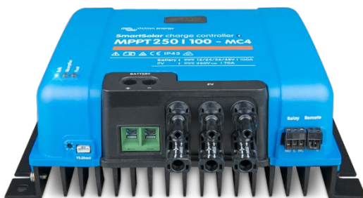
SmartSolar-Laderegler MPPT 250/100-MC4 ohne Display