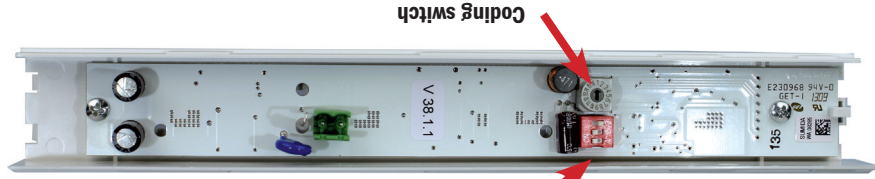
DIP-switch S1, S2, S3

The emergency LED fitting KM-ZBA is suitable for use in central battery emergency lighting systems of types microControl plus, miniControl plus, midiControl plus, multiControl plus and MDC.